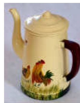
TELETHON LAZ 2009 Cafetière010