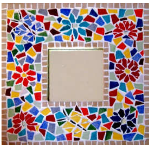
TELETHON LAZ 2009 Glace040