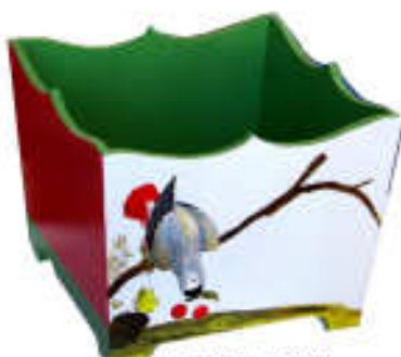
TELETHON LAZ 2009 Cache-pot au perroquet