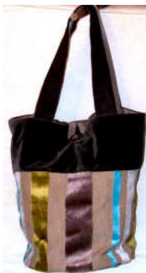
TELETHON LAZ 2009 Sac à main "grand couturier"040