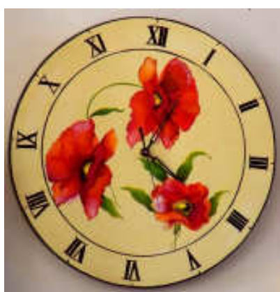
TELETHON LAZ 2009 horloge040