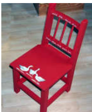
TELETHON LAZ 2009 Chaise 040