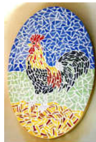
TELETHON LAZ 2009 dino040