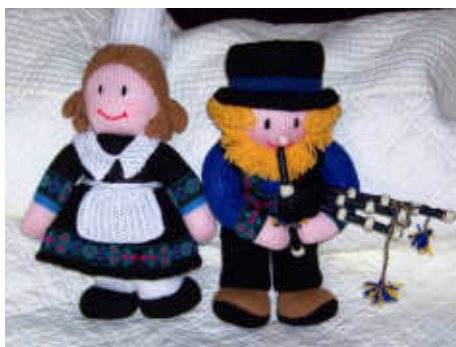
TELETHON LAZ 2009 Bigoudens010