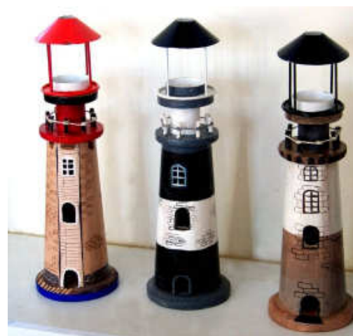
TELETHON LAZ 2009 Phares 010 à 030

Rocking-chair et chaises de poupées, paniers, animaux, confituriers, triptyques, écrioires, confituriers, porte-bouteilles, sacs mode, mosaïques ; ce ne sont que quelques exemples de la multitude d'articles, tous différents, que les bénévoles de Laz mettront en vente lors du TELETHON 2009