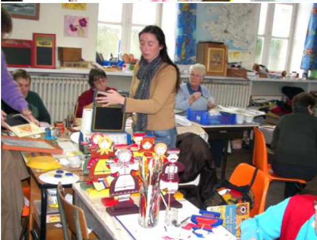
Quelques bénévoles au travail