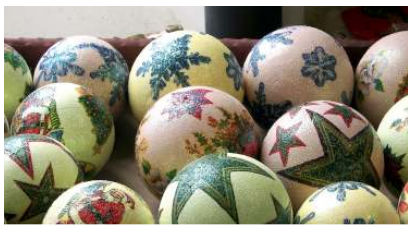
Quelques-uns des articles qui seront mis en vente samedi et dimanche