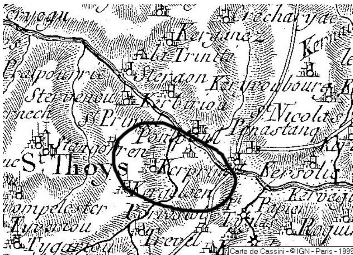
Carte de Cassini - © IGN - Paris - 1999