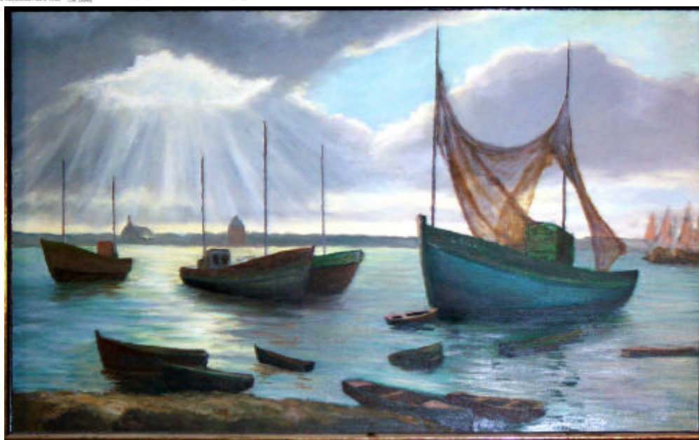
"Lumière d'estuaire" Peinture de Yves Hervocho vers 1980 Don de l'auteur à la commune de Laz