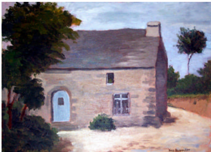
Longère dan sla campagne de Laz Yves Hervocho Coll. Le Ster