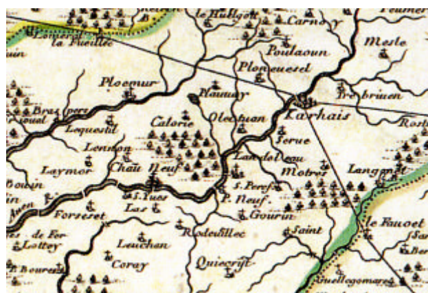
Carte Duval (1683-1689). 1° carte mentionnant Laz (Las) (Pont-Neuf = Pont du Stang, Saint Yves = Saint Thois)

Il faudra attendre la carte de Duval (1683-1689) pour voir apparaître le nom de Laz (Las) :