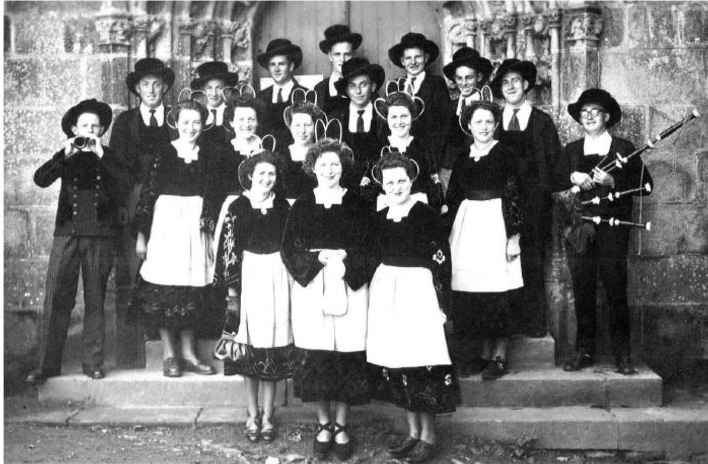
Le Cercle Celtique de Laz en 1950 Sur le porche de la chapelle de Notre-Dame des Portes