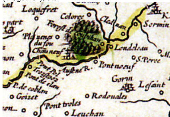
Carte de Hardy (1630). Région de Châteauneuf Pont Coblan, Pont Pol et le pont du Stang (Pont neuf) sont indiqués

En 1630, Hardy indique Pont-Pol, Rodouales (Roudouallec), Lefan (Leuhan), Trestoes (Trégourez), etc.