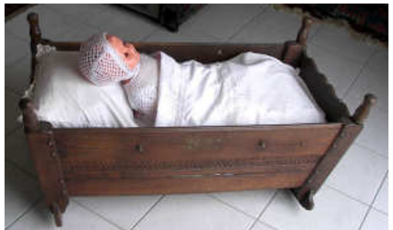
Berceau de ferme 1897, utilisé jusqu'en 1944 Coll. Richard

le berceau du bout du pied, tout en cousant ou brodant, ou du lit, la nuit, sans se lever. Lors de la dernière guerre, le berceau servit à des membres de la famille réfugiés dans une petite maison et le bruit du berceau se dandinant sur le plancher, actionné de son lit par la maman, est resté dans la mémoire de tous ceux qui connurent cette période