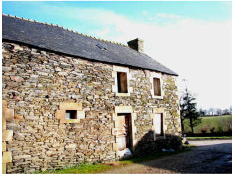
La "Maison des Parents" de Ker Menez

La maison des parents fut, elle occupée jusqu'en 1973.