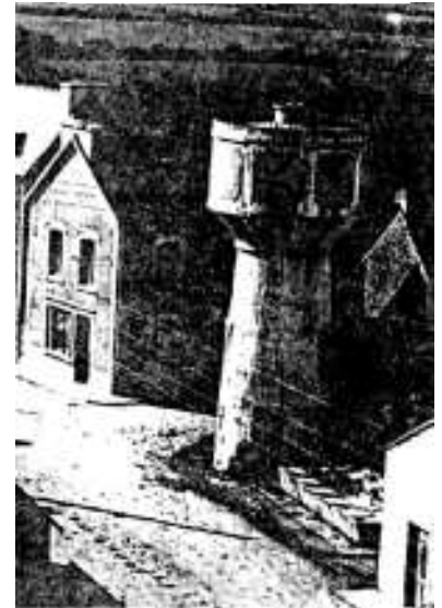
Le château d'eau et le lavoir

Le principal près du château d'eau, à l'emplacement de la Mairie actuelle, desservait un abreuvoir et un lavoir municipal, qui devint un important centre de rencontre et anima la vie du Bourg jusque dans