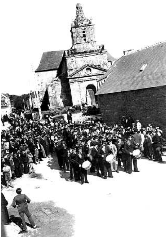
Fête de l'eau été 1938: l'aubade devant le château d'eau