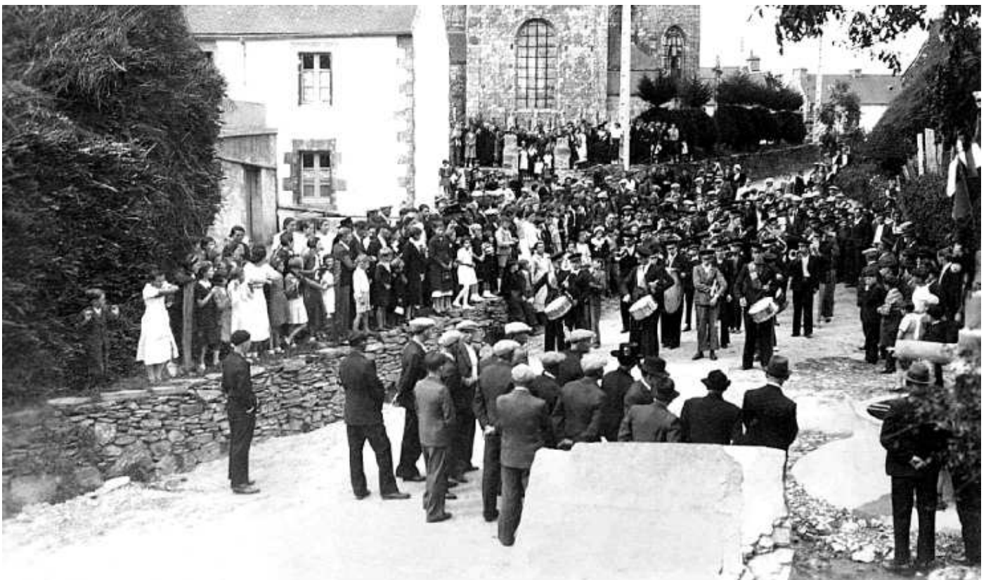
Été 1938. L'aubade devant l'abreuvoir de la rue de l'Odet. A droite, réserve de fagots de la boulaberie