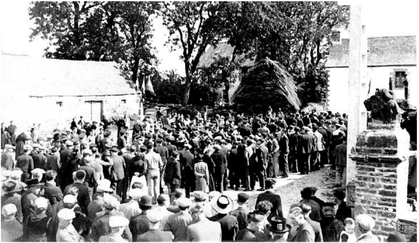
Fête de l'eau été 1938: inoguration du lavoir de la rue de l'Odet. Remarquer la réserve de fagots de la boulangerie