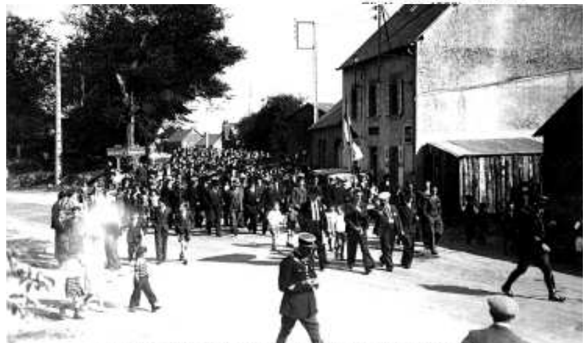
Fête de l'eau été 1938: départ du défilé du champ de foire actuel